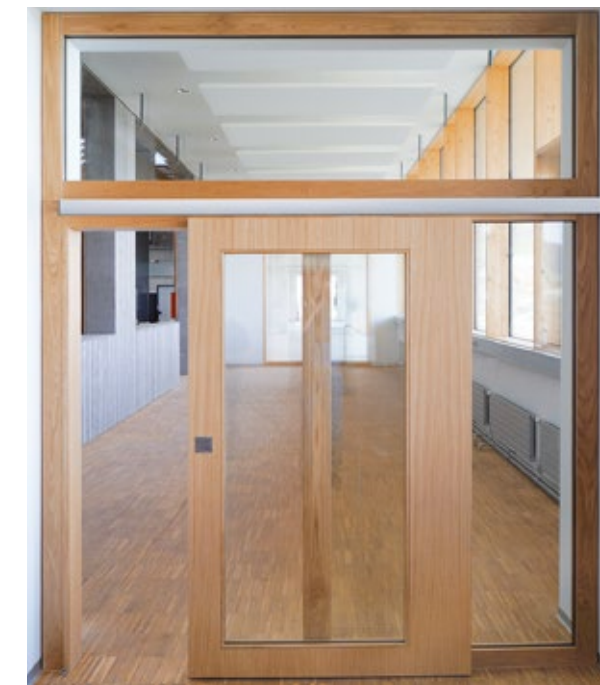
Ferrures : Hawa Suono 100, ébrasement : BRUNEX BLOCTool, ouvrant : Silencium Alu 59